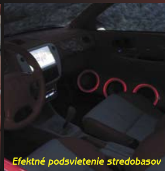
Efektne podsvietenie stredobasov