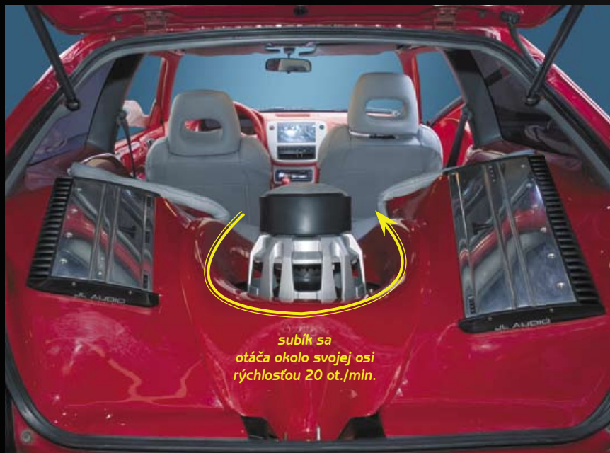
subík sa otáča okolo svojej osi rýchlosťou 20 ot./min.