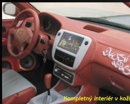
Kompletný interiér v koži