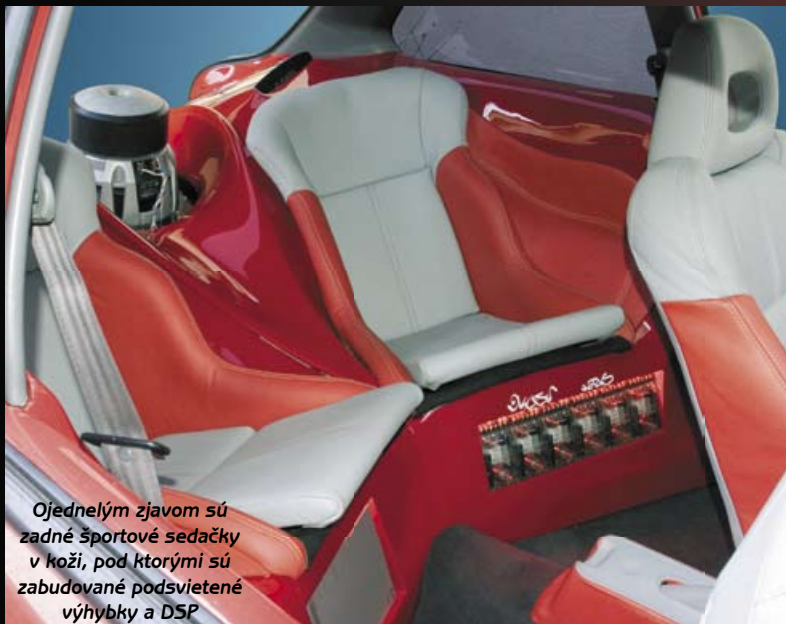
Ojedinelým zjavom sú zadné športové sedačky v koži, pod ktorými sú zabudované podsvietené výhybky a DSP